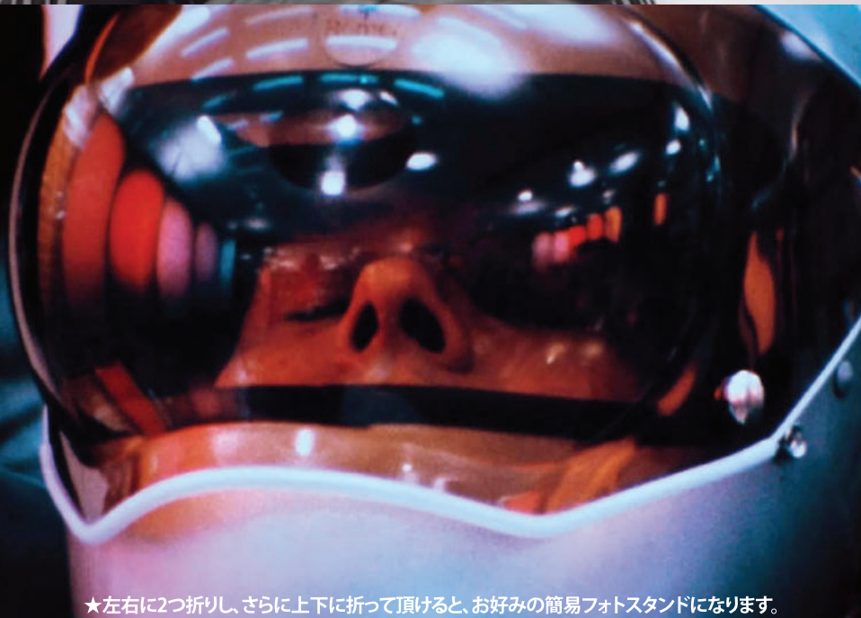
★左右に2つ折りし、さらに上下に折って頂けると、お好みの簡易フォトスタンドになります。