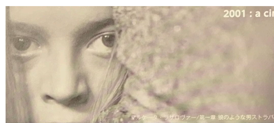
マルケータ・ラザロヴァー/第一章 狼のような男ストラバ